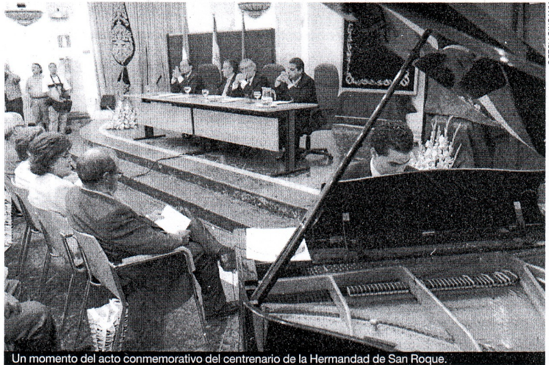
Un momento del acto conmemorativo del centenario de la Hermandad de San Roque.

COFRADÍAS ■ La Hermandad presentó ayer el calendario de actividades, el cartel y las medallas conmemorativas de la efeméride